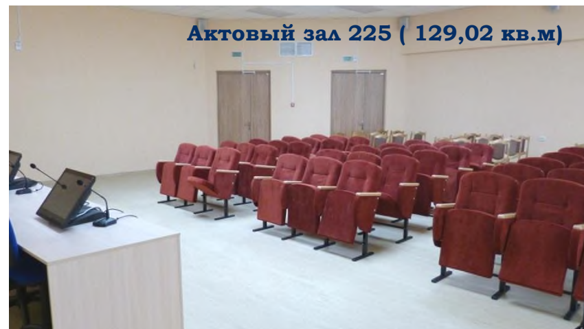
Актовый зал 225 ( 129,02 кв.м)