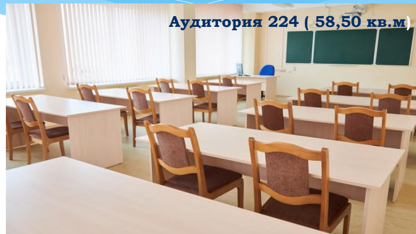
Аудитория 224 ( 58,50 кв.м)