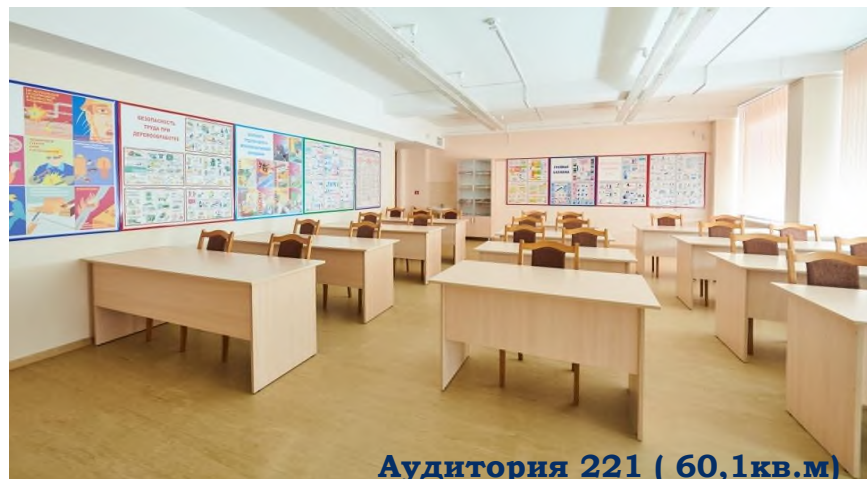
Аудитория 221 ( 60,1 кв.м)