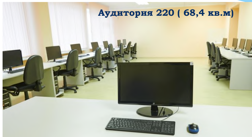
Аудитория 220 ( 68,4 кв.м)